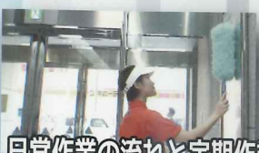
日常作業の流れと定期作業

一般社団法人 大阪ビルメンテナンス協会 ビルクリーニング部会 (株)加藤均総合事務所/美業建物管理(株)/(株)栄光社/関西明装(株)/(株)カンソー/北大阪ビルメンテナンス(株)近建ビル管理(株) 興産管理サービス・西日本(株)/(株)ケイ・エス・サービス/互光建物管理(株)/(株)ジェイアール西日本総合ビルサービス (株)ジェイアール西日本メンテック/信栄ビルサービス(株)/星光ビル管理(株)/(株)太陽ビルマネージメント/東宝ビル管理(株) 南海ビルサービス(株)/南北ビルセイビ(株)/(株)ビケンテック/ビューテック(株)/(株)三橋商会/装栄(株)/(株)テラモト/シーバイエス(株) ベンギンワックス(株)/(株)リソレイ/一般社団法人 関西環境開発センター